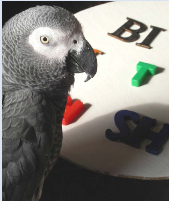
Alex and his birthday card.

We just got a new baby Grey, so a lot of our work will involve tracking her development, and comparing her abilities to those of our older bird.