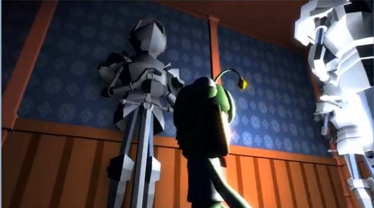
Screenshot uit het spel MindLight

Meer over GainPlay Studio is te vinden op de (binnenkort vernieuwde) website van www.dreamsofdanu.com